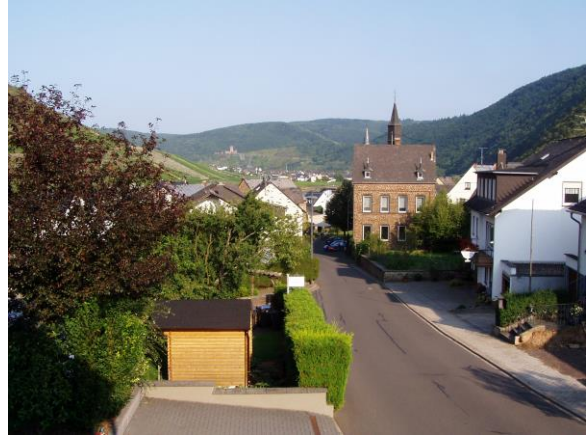
Der Blick von unserem Balkon in die reizvolle Mosellandschaft

Wir sind ein Weinhaus mit Gästezimmern und Ferienwohnung. Unser Dorf Briedern liegt im schönen Moseltal, zwölf Kilometer moselaufwärts von Cochem entfernt. Briedern ist ein Nachbarort des sehr bekannten Beilstein.