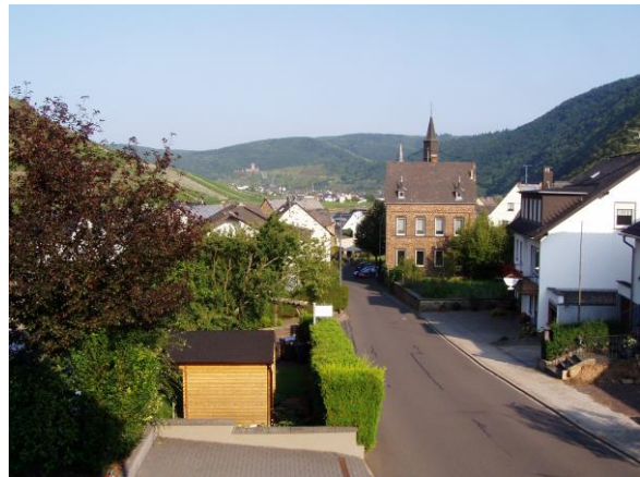
Der Blick von unserem Balkon in die reizvolle Mosellandschaft

Wir sind ein Weinhaus mit Gästezimmern und Ferienwohnung. Unser Dorf Briedern liegt im schönen Moseltal, zwölf Kilometer moselaufwärts von Cochem entfernt. Briedern ist ein Nachbarort des sehr bekannten Beilstein.