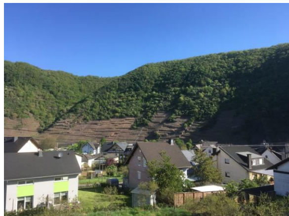
Der Blick vom großen Balkon der Ferienwohnung in die reizvolle Mosellandschaft

Unsere komfortable Ferienwohnung hat ca. 75 qm, 2 Doppel-Schlafzimmer, eine komplett Bad mit Dusche und WC, ein separates WC und zwei Balkone. Bettwäsche, Handtücher, Brötchendienst, Parkplatz am Haus, Garage für Motor- und Fahrräder und Gäste-Ticket sind inklusive. Die Ferienwohnung wurde 2020 neu renoviert und eingerichtet.