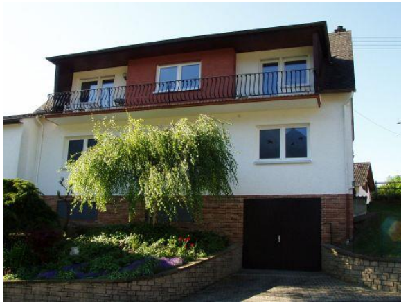
Außenansicht der Ferienwohnung (gesamte obere Etage) mit großem Balkon

Sie können bei uns einen geruhsamen wie auch aktiven Urlaub verbringen, z. B. mit Angeln, Spazieren gehen, Wandern, Nordic-Walking oder Fahrrad fahren. Auch für Motorradfahrer ist unsere Region ein Paradies. Außerdem gibt es in der Umgebung viele Sehenswürdigkeiten.