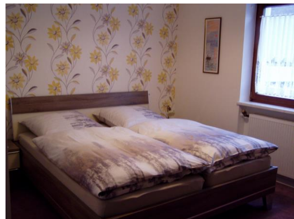
Die gepflegten Gästezimmer mit Sat-TV, WLAN, Dusche und WC.

Der Preis für Übernachtung mit Frühstück und Gäste-Ticket liegt pro Person zwischen 29 und 36 €.