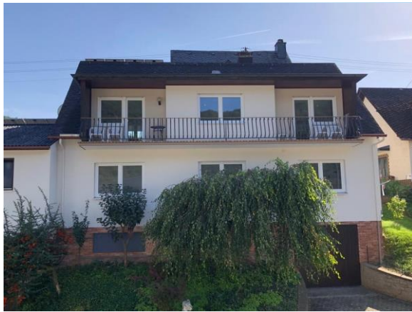
Außenansicht der Ferienwohnung (gesamte obere Etage) mit großem Balkon

Sie können bei uns einen geruhsamen wie auch aktiven Urlaub verbringen, z. B. mit Angeln, Spazieren gehen, Wandern, Nordic-Walking oder Fahrrad fahren. Auch für Motorradfahrer ist unsere Region ein Paradies. Außerdem gibt es in der Umgebung viele Sehenswürdigkeiten.