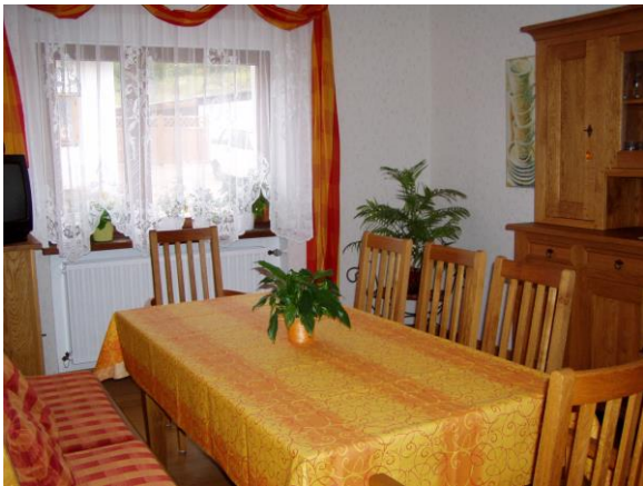
In unserem gemütlichen Aufenthaltsraum mit Kühlschrank wird auch das reichhaltige Frühstück serviert

Sie können bei uns einen geruhsamen wie auch aktiven Urlaub verbringen, z. B. mit Angeln, Spazieren gehen, Wandern, Nordic-Walking oder Fahrrad fahren. Auch für Motorradfahrer ist unsere Region ein Paradies. Außerdem gibt es in der Umgebung viele Sehenswürdigkeiten.